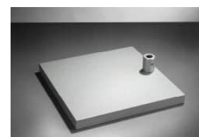
Tischfuss 10,5 kg