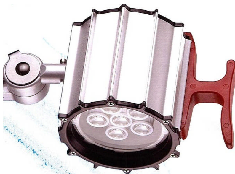
IP 65 RTL