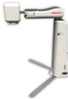
Lese- und Schreib- position