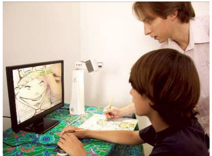
Sich selbst betrachten