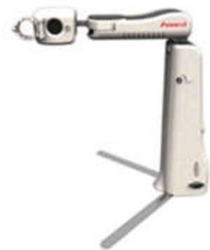
Nahposition für Selbstansicht